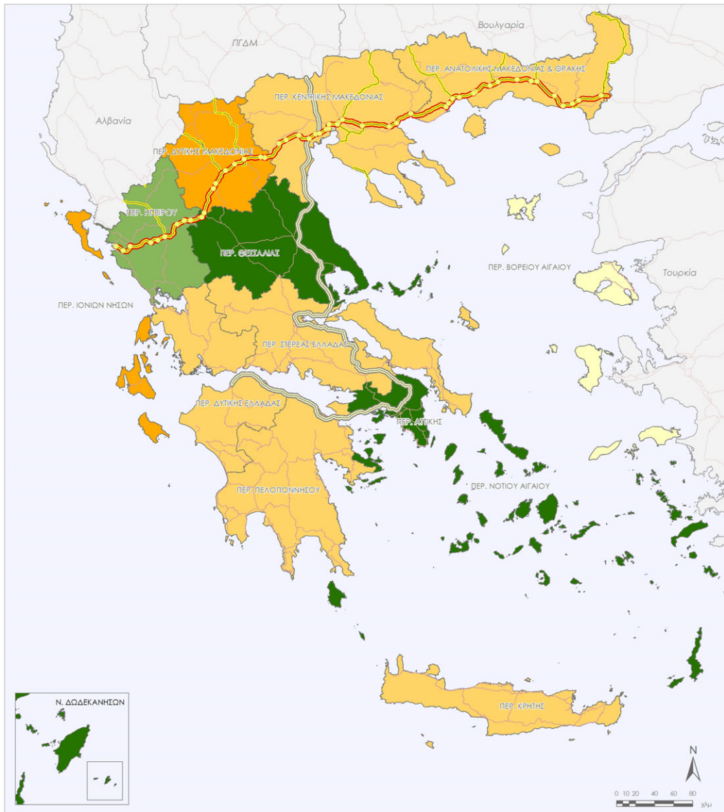
Χάρτης 2: Μεταβολή ανεργίας ανά Περιφέρεια, 1999- 2004