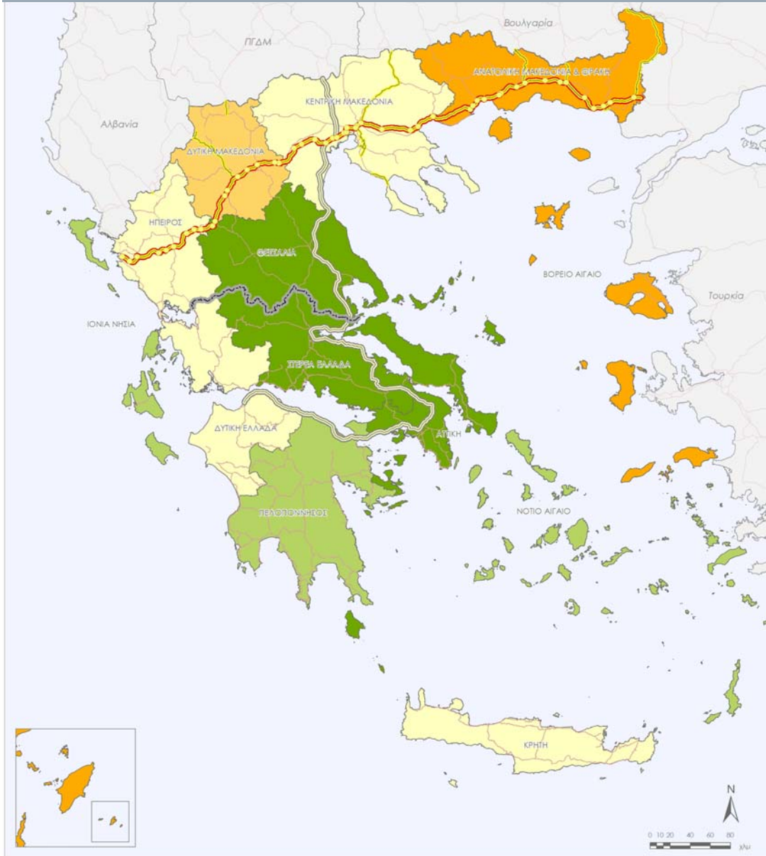
Χάρτης 3. Μεταβολή ανεργίας ανά Περιφέρεια, 2000-2005