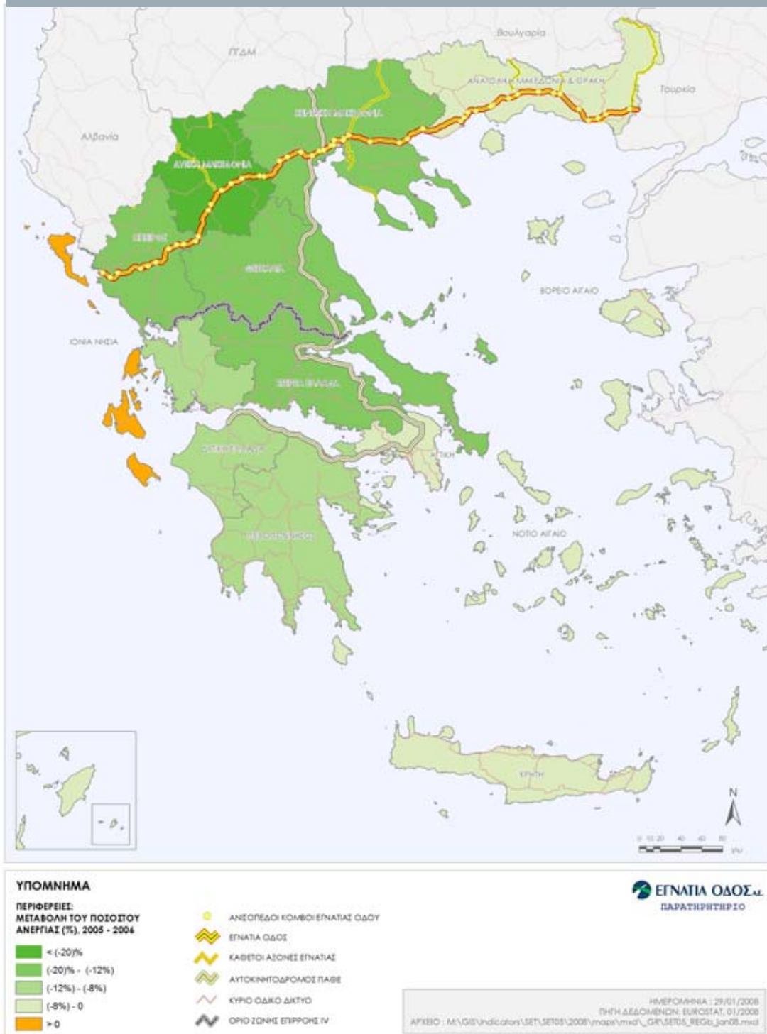
Χάρτης 2. Μεταβολή ανεργίας ανά Περιφέρεια, 2005-2006