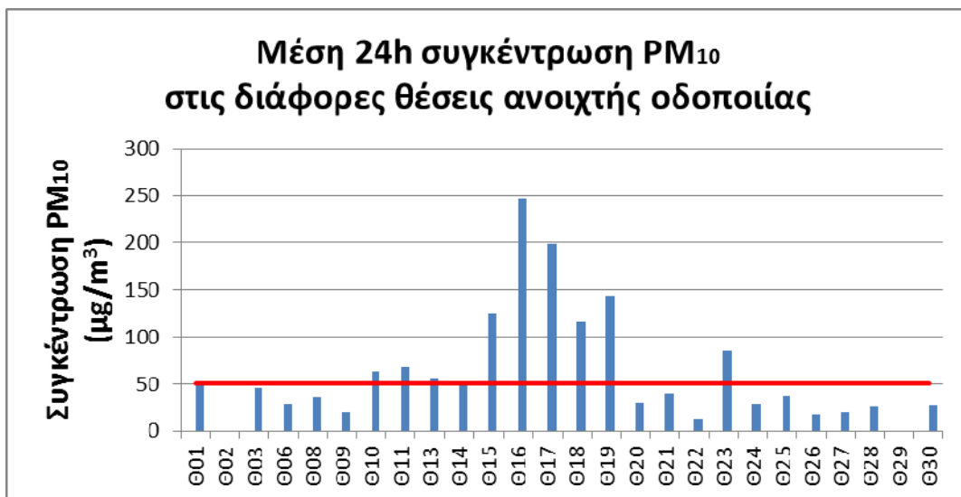
Διάγραμμα 1: Συγκέντρωση \text{PM}_{10} στις θέσεις ανοιχτής οδοποιίας

ημερήσιου ορίου, είναι οι: Θ01 ΗΓΟΥΜΕΝΙΤΣΑ (49 \mu\text{g}/\text{m}^3 ), Θ03 ΔΙΟΔΙΑ ΤΥΡΙΑ (46 \mu\text{g}/\text{m}^3 ), Θ14 ΝΗΣΕΛΙ (49 \mu\text{g}/\text{m}^3 ). Σύμφωνα με την νομοθεσία τα 50 \mu\text{g}/\text{m}^3 είναι η μέση ημερήσια τιμή, της οποίας δεν πρέπει να σημειώνεται υπέρβαση περισσότερες από 35 φορές ανά έτος. Βέβαια, ακόμη και στην περίπτωση αυξημένων ημερήσιων ορίων είναι σημαντικός ο εντοπισμός του συνόλου των ημερών ανά έτος που παρατηρείται υπέρβαση. Τα αποτελέσματα φαίνονται στο παρακάτω συγκεντρωτικό διάγραμμα.