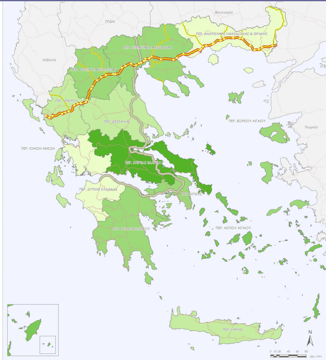
Χάρτης 1. ΑΕΠ/κάτοικο ανά Περιφέρεια, 2002