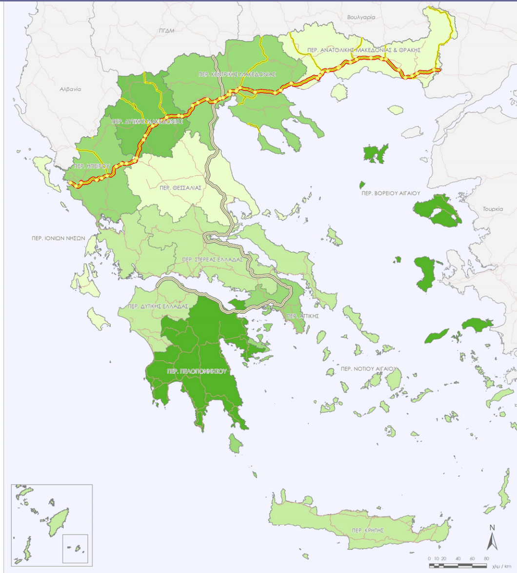
Χάρτης 3. Ετήσιος ρυθμός μεταβολής του ΑΕΠ/κάτοικο ανά Περιφέρεια, 2000-02