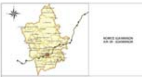
ΧΑΡΤΗ ΧΩΡΟΥ KAVALA